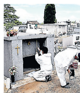
Le caveau profané a été refermé hier.

Des cercueils ont été éventrés, des crânes et des ossements dispersés dans le cimetière du village de Capendu. Une enquête a été ouverte sur cette profanation. • page 6