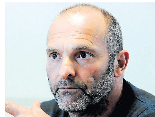
Le Savoyard restera toulousain l'an prochain.

Le coach toulousain sera bien sur le banc du TFC la saison prochaine. Son agent l'a confirmé, hier, pour mettre un point final aux rumeurs de départ. • page 12